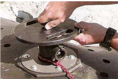
7 Eine Belastungsplatte wird auf den Feuerungsmechanismus geschraubt.