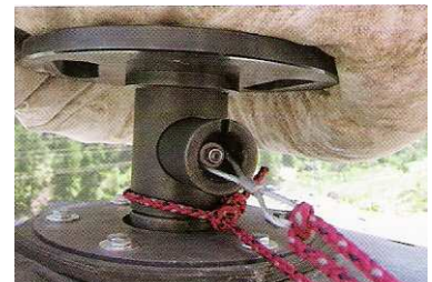
9 Ein Verbindungsstück wird mit beiden Kugeln an den Rock Cracker™ eingehängt.