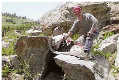
11 Das Resultat: Der Stein wurde erfolgreich mit dem Rock Cracker™ in mehrere Teile gespalten.