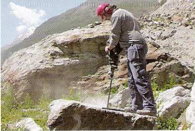
1 Das Loch wird hier mit einem \varnothing von 28 - 45 mm gebohrt.