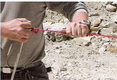
10 Aus sicherer Distanz wird mit der Abzugschnur die Spaltung ausgelöst.