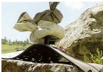
8 Der Rock Cracker™ wird mit Sandsäcken beschwert.