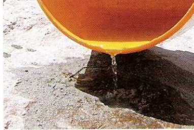
2 Das Loch wird nun mit Wasser gefüllt. Wenn der Stein porös ist, wird Gel zur Abdichtung benutzt.