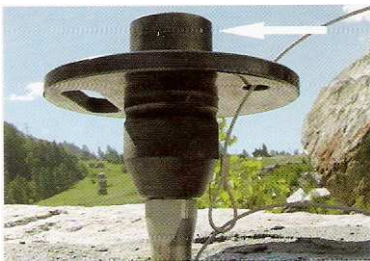
4 Das Querstück wird in das Loch eingefügt. Die weiße Marke oben (Pfeil) zeigt die Zugrichtung an.