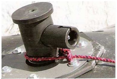
6 Der Feuerungsmechanismus wird eng in das Querstück geschraubt.