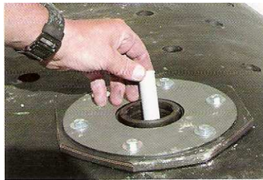
5 Die Sicherheitsmatte (1.4 x 1.4 m) wird in die richtige Lage gebracht und die Startpatrone wird in das Querstück eingeführt.